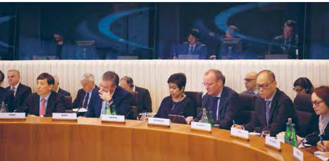
Gabenor Nor Shamsiah Yunus dan rakan-rakan gabenor di Mesyuarat Ekonomi Global BIS pada bulan Mei 2019.

Bank kerap berkongsi pengalaman dan kepakaran teknikalnya dengan bank-bank pusat lain, pihak berkuasa penyeliaan dan institusi berkaitan