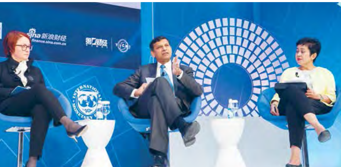
Gabenor Nor Shamsiah Yunus dan rakan ahli panel dalam perbincangan sampingan mengenai "Pengurusan Aliran Modal: Apakah Gabungan Dasar Yang Betul?" semasa mesyuarat Musim Bunga IMF-WBG pada bulan April 2019.

dalam pelbagai isu. Pelaksanaannya dibuat dengan menganjurkan lawatan sambil belajar, menganjurkan seminar dan bengkel serta menghantar kakitangan Bank untuk menganjurkan program di negara dan organisasi mereka. Bank juga bekerjasama erat dengan organisasi antarabangsa lain, seperti Pusat Latihan dan Penyelidikan Bank-bank Pusat Asia Tenggara ( South East Asian Central Banks, SEACEN ), Persatuan bagi Rangkuman Kewangan ( Alliance for Financial Inclusion, AFI ) dan Bank Dunia untuk menganjurkan beberapa program. Dengan berkongsi perspektif dari pihak Bank dan Malaysia, Bank berharap dapat menyokong bank-bank pusat lain membina keupayaan mereka, dan dengan itu meningkatkan lagi kestabilan monetari dan kewangan global. Pada tahun 2019, Bank telah berbincang dan berinteraksi dengan 61 negara dalam aktiviti kerjasama teknikal.