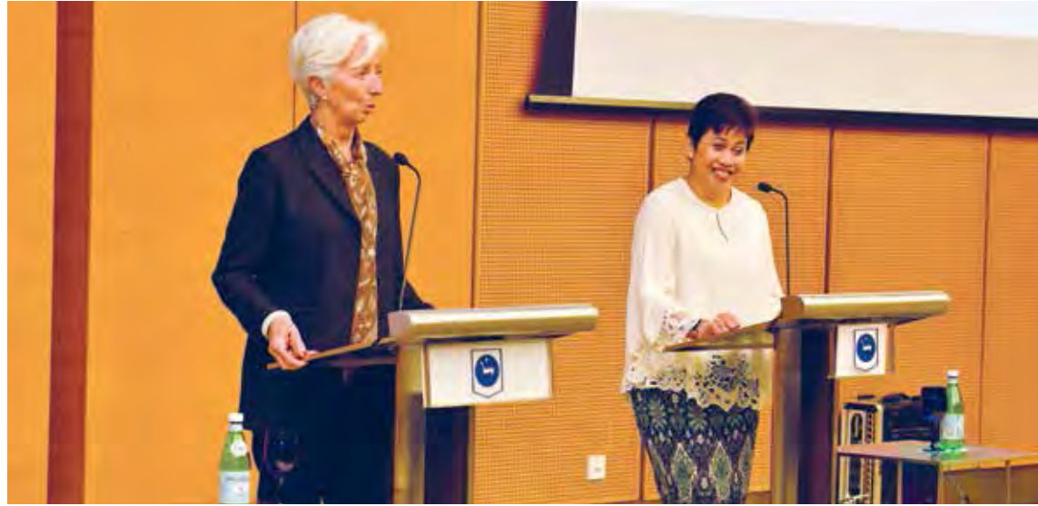
Gabenor Nor Shamsiah Yunus bersama-sama mantan Pengarah Urusan IMF Christine Lagarde semasa lawatan beliau ke Kuala Lumpur pada bulan Jun 2019.

yang pertama mula beroperasi di rantau ini dan akan meraih manfaat daripada keistimewaan yang diberikan.