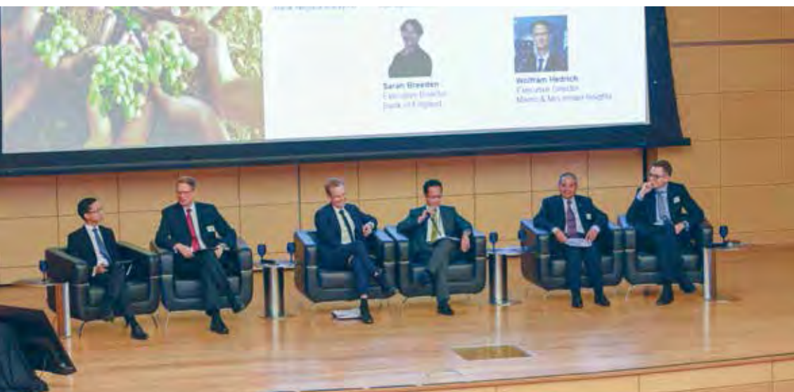
Penolong Gabenor Aznan Abdul Aziz di Persidangan Serantau Risiko Perubahan Iklim dan Peluang: Respons Secara Berhemat pada bulan September 2019.

pertama yang bertemakan Risiko Perubahan Iklim dan Peluang: Bertindak Secara Berhemat pada bulan September 2019 bagi mewujudkan kesedaran dan peluang kepada sektor kewangan dalam ekonomi hijau. Bank turut menerajui agenda kemampanan serantau dengan menyetujui kajian tentang peranan bank-bank pusat ASEAN dalam pengurusan risiko berkaitan dengan iklim dan alam sekitar. Usaha kolektif bank-bank pusat ASEAN ini bertujuan untuk lebih memahami risiko tersebut dan implikasinya kepada kestabilan monetari dan kewangan. Matlamat yang ingin dicapai adalah untuk mengesyorkan kaedah pengurusan risiko berkaitan dengan iklim dan alam sekitar kepada bank-bank pusat ASEAN, di samping menyokong peralihan kepada ekonomi rendah karbon.